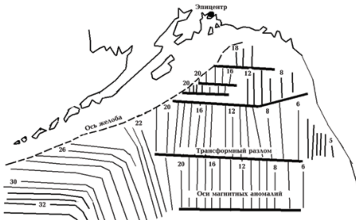
Рис. 2. Распределение полосовых магнитных аномалий в северной Пасифике [Кузьмин и др., 2000].

зано выше и более подробно в статье. Говорит об этом и Л. М. Балакина: "Сторонники гипотезы тектоники плит выбирают пологие нодальные плоскости в решениях механизмов очагов в качестве разрывов в очагах поверхностных землетрясений на том основании, что последние лучше согласуются с идеей субдукции. Не могут быть доказательством существования пологих надвигов оценки параметров разрывов в очагах путем сопоставления наблюдаемых и теоретических сейсмограмм ввиду неоднозначности решения соответствующей обратной задачи" [Балакина, 2002, с. 132]. Перчатка брошена, но не поднята. Ни в статье Хэслера и др., ни во множестве иных публикаций на эту тему в этом районе (я сейчас активно пересматриваю материалы по сейсмичности всей Циркумпасифики) нет ни одной попытки защитить "консенсус". Это (не замечать) — удобнее всего.